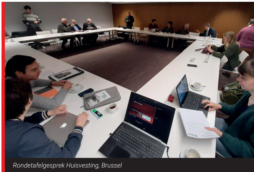
Rondetafelgesprek Huisvesting, Brussel

Voor Caritas leverde deze vruchtbare uitwisseling alvast materiaal om verder mee aan de slag te gaan. Er is immers nog werk aan de winkel!