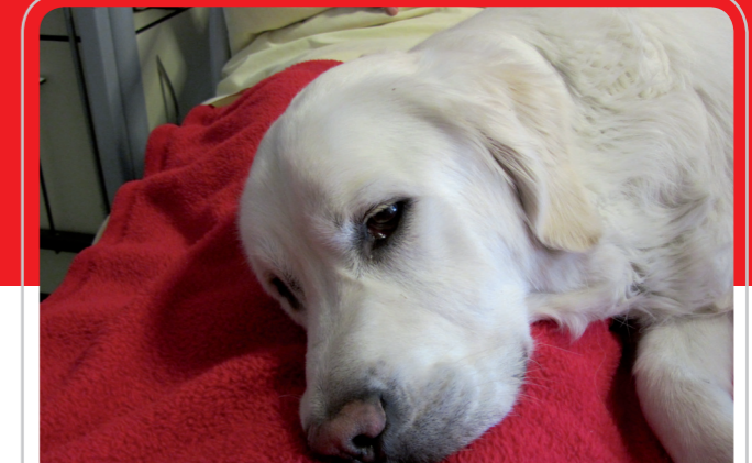
met dank aan AZ St. Lucas, Palliatieve Zorg St. Vincentius, Gent

Present Caritas Vrijwilligerswerk biedt voor vrijwilligers die zich engageren in de palliatieve zorg een eigen opleiding. Hierbij wordt ingegaan op specifieke thema's in de palliatieve zorg, zoals bijvoorbeeld pijn- en symptoomcontrole, rouw, psychosociale aspecten van ziek zijn en verlies, zingevende en religieuze invalshoek, naast algemene elementen rond vrijwilligerswerk.